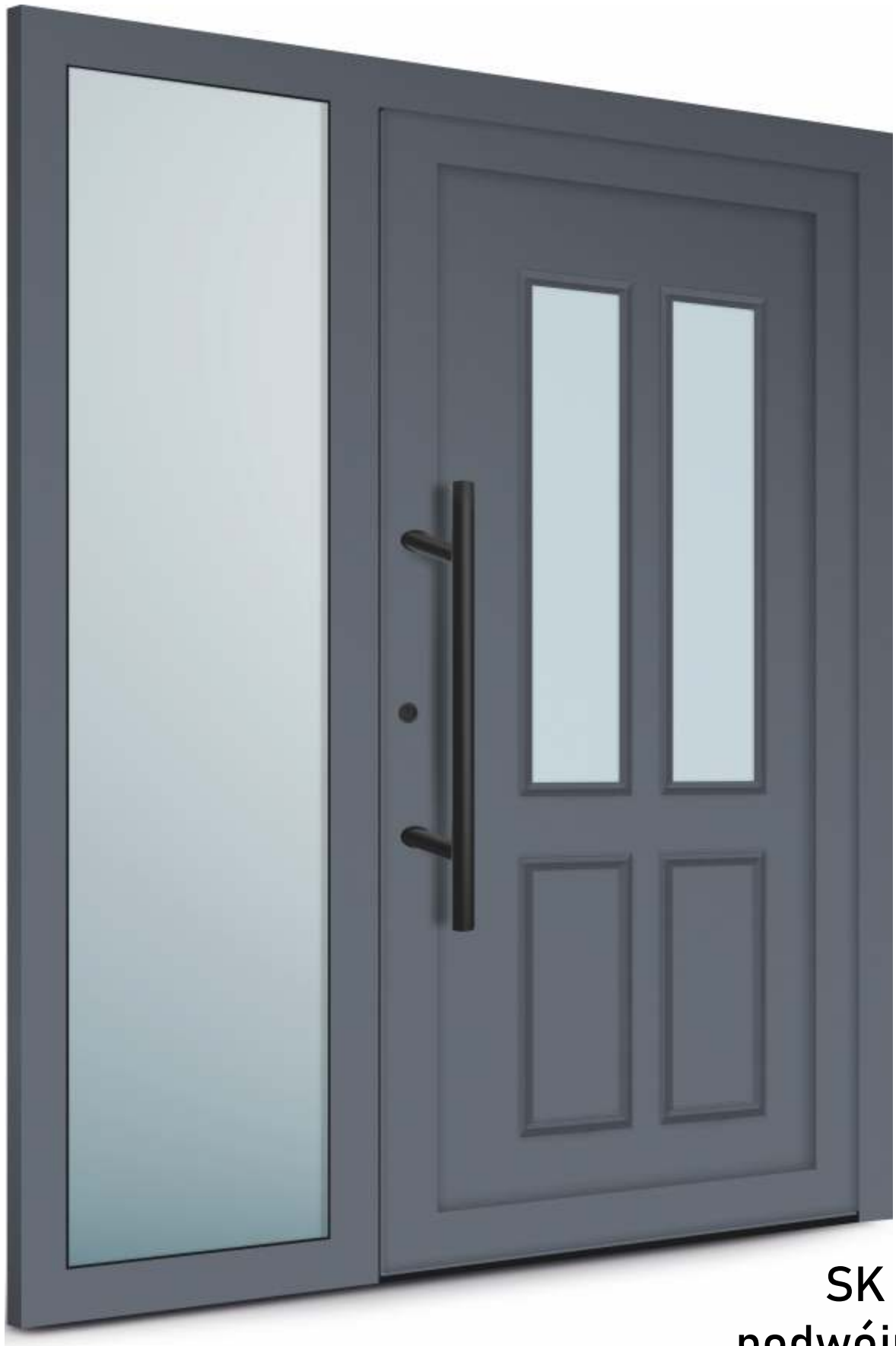
SK 10 podwójny