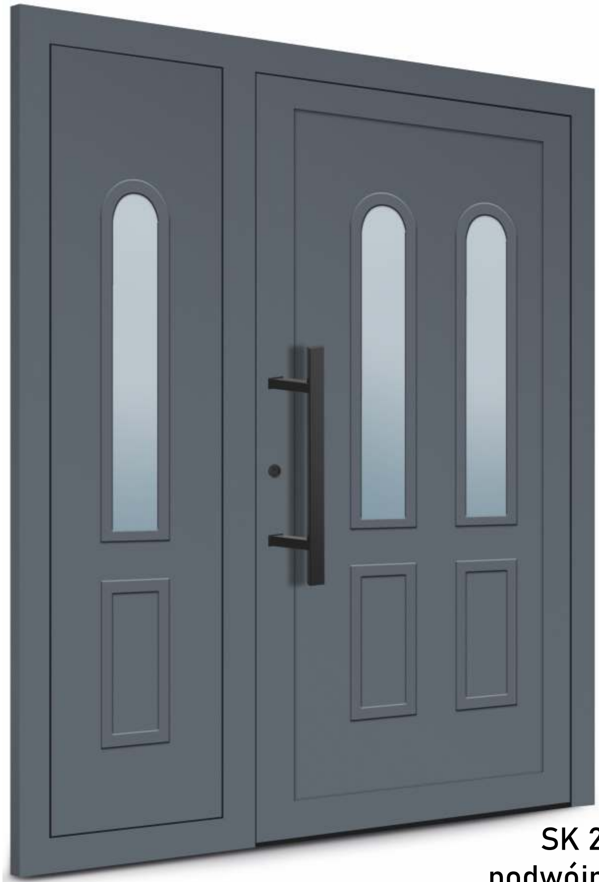
SK 23 podwójny